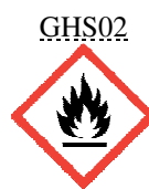
Tűzveszélyes folyadék 3. kat

Tűzveszélyes folyadék ..... -Flamm Liq. 3 ..... H226 Bőrirritáló hatású ..... -Skin Irrit 2 ..... H315