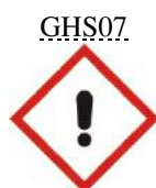
Akut toxicitás 4. kat