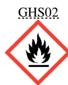
Tűzveszélyes folyadék 3. kat

Tűzveszélyes folyadék ..... -Flamm Liq. 3 ..... H226 Bőrirritáló hatású ..... -Skin Irrit 2 ..... H315