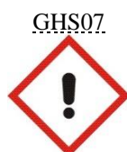
Akut toxicitás 4. kat