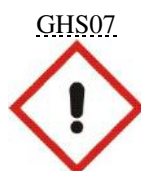
Akut toxicitás 4. kat