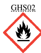
Tűzveszélyes folyadék 3. kat

Tűzveszélyes folyadék ..... -Flamm Liq. 3 ..... H226 Bőrirritáló hatású ..... -Skin Irrit 2 ..... H315